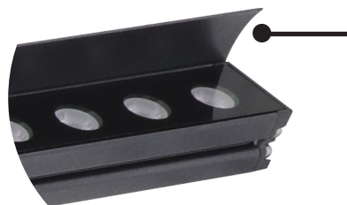
Accesorio para wall washer (Se vende por separado) WW-SD1