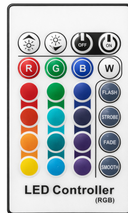
Incluye Control Remoto